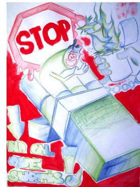
Samarreta de Girona