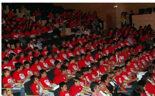
550 espectadors a l'Auditori de Girona celebraren el Dia Mundial Sense Tabac

En motiu del Dia Mundial Sense tabac (31 de maig) s'organitza la cloenda del programa, en una celebració a la que es convida a tots els joves, que han participat en el programa.